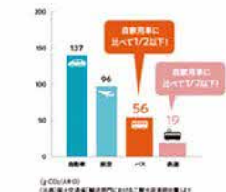
図2 1人が1km移動する際のCO 2 排出量（2019年度推定）