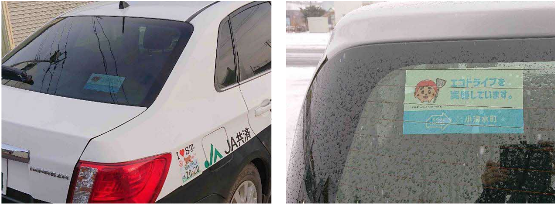
図 15 エコドライブ普及資材（ステッカー）掲示の様子