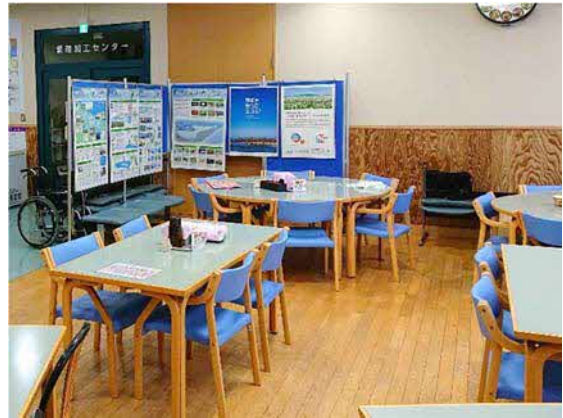
図 10 公共交通利用推進パネル 掲示の様子（道の駅はなやか小清水）