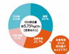
図1 北海道の家庭の用途別CO 2 排出割合