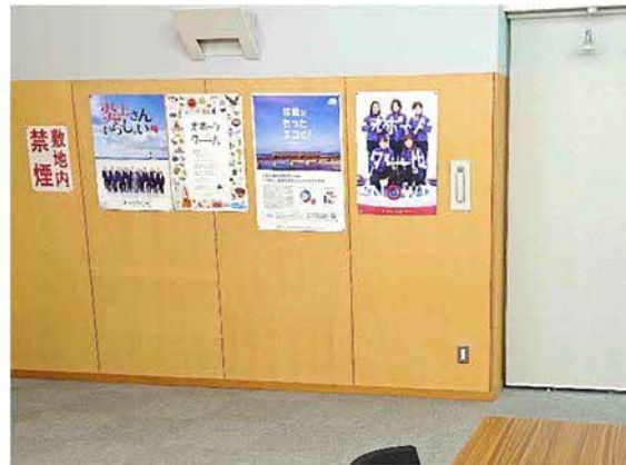
図 11 公共交通利用推進ポスター 掲示の様子（小清水町役場／美和住民センター）