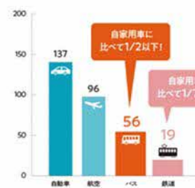
図2 1人が1km移動する際のCO 2 排出量（2017年度 換算）

（g=CO 2 /人・km）